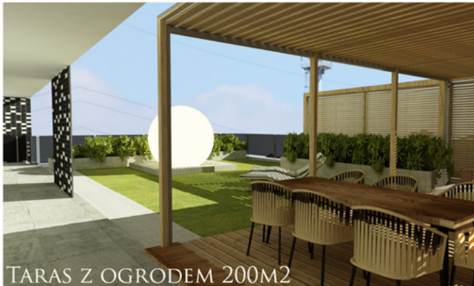
TARAS Z OGRODEM 200M 2