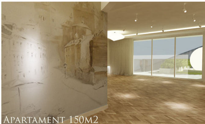
APARTAMENT 150M 2